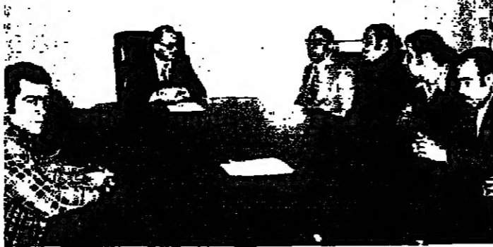
وفد السائقين ومالكي السيارات